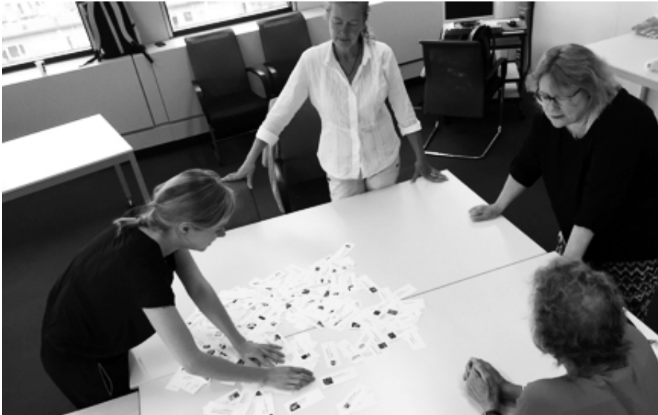
Afbeelding 2. Het gezamenlijk ordenen van de aanbod-kaartjes

wonen met dementie. Goede informatie over toepassing van producten is nodig en gebleken is dat deze niet altijd makkelijk te vinden is. Een product als een zwaartedeken bijvoorbeeld kan bescherming en geborgenheid bieden en daardoor mogelijk onrust tegengaan. Dit is zonder toelichting niet op voorhand duidelijk.